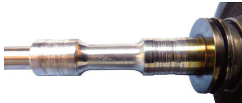
Riefen am Radiallagerdurchmesser der Läuferwelle